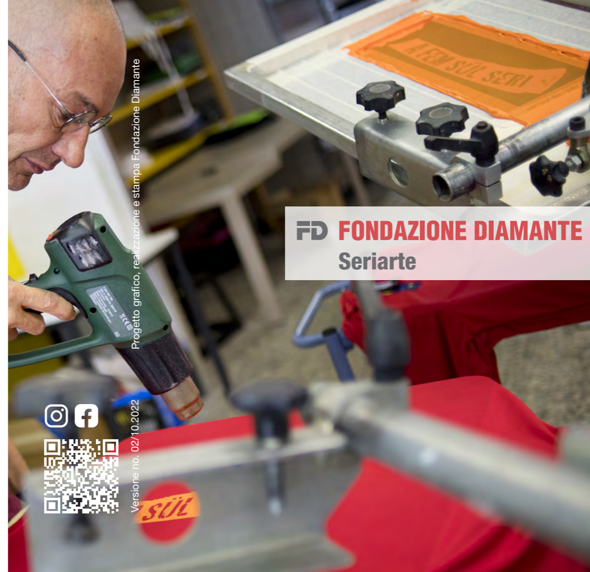
Progetto grafico, realizzazione e stampa Fondazione Diamante

seriarTE@f-diamante.ch seriarTEgrafica@f-diamante.ch seriarTEserigrafia@f-diamante.ch www.f-diamante.ch